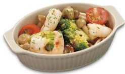
信州産きのこ エビのアヒージョ