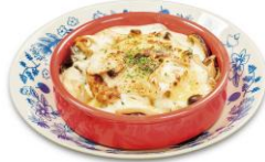
5種のキノコと ハンバーグのドリア