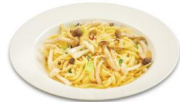
きのこ野菜の ペペロンチーノ