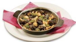
エスカルゴとキノコの オープン焼き