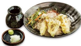
きのこ天ぷら ぶっかけ蕎麦