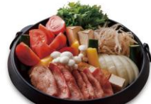
トマトときのこ 黒毛和牛のすき焼き