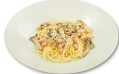
5種のキノコとベーコンの クリームパスタ