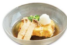
揚げ出し豆腐の エリンギ添え