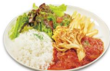
ハンバーグプレート 〜舞茸とトマトソース〜