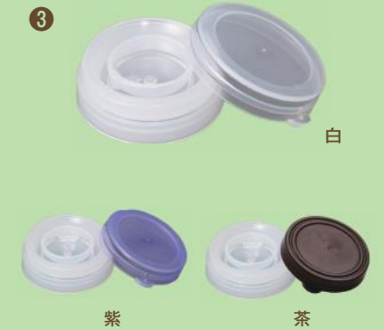
③ フルトップキャップ(白、紫、茶)