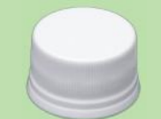
⑩ 白無地D NOSP スリット